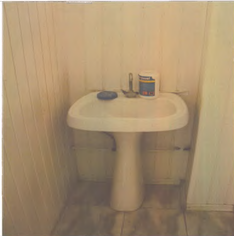
17 туалетная комната