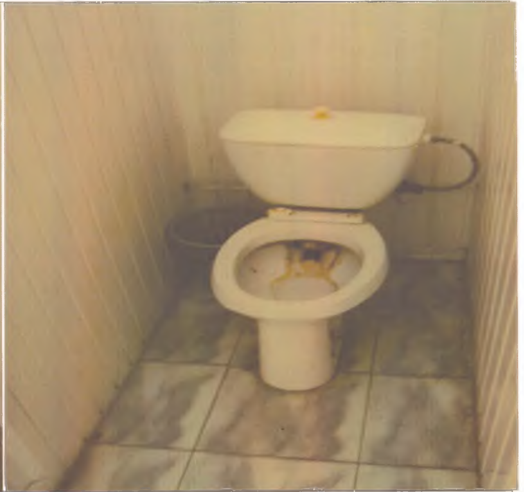
18 туалетная комната