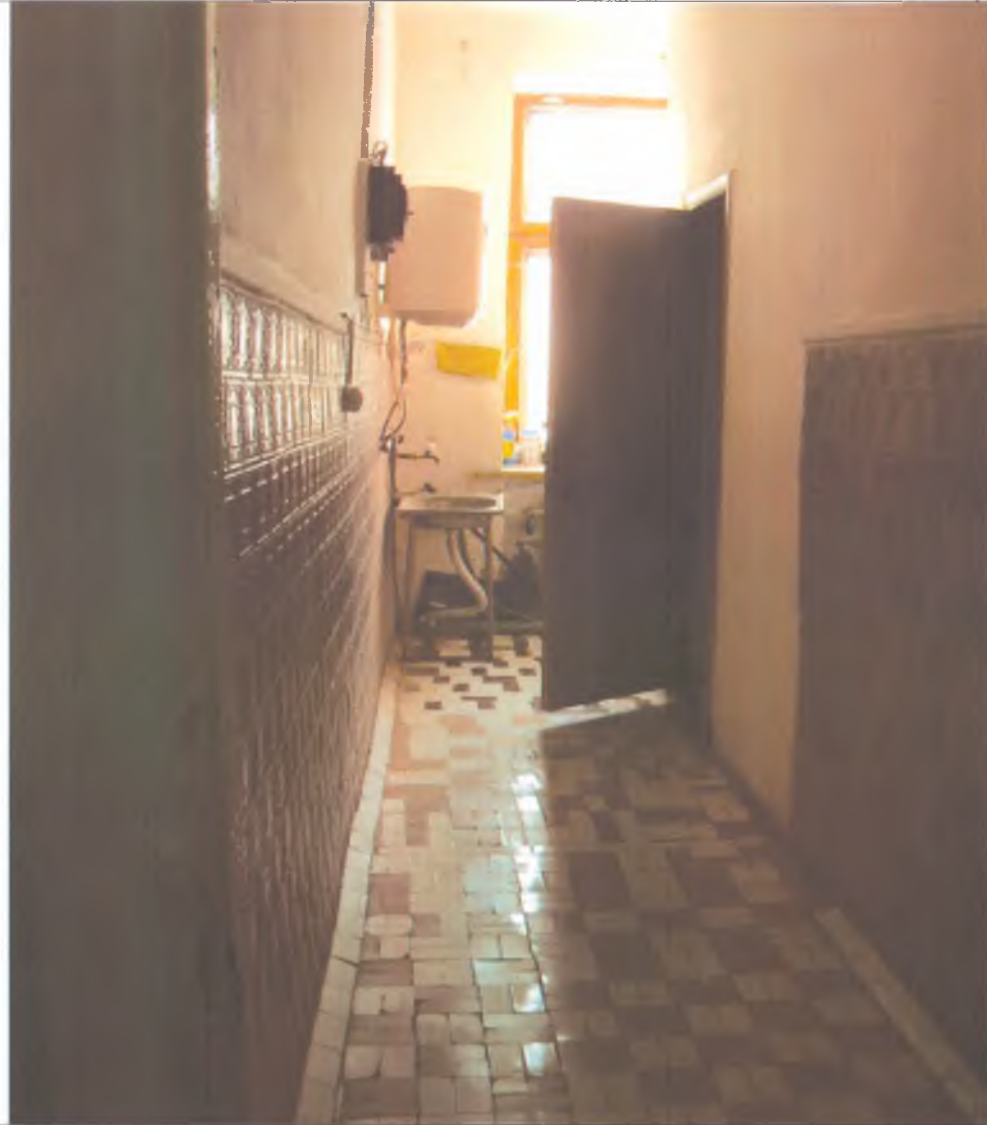
15 туалетная комната