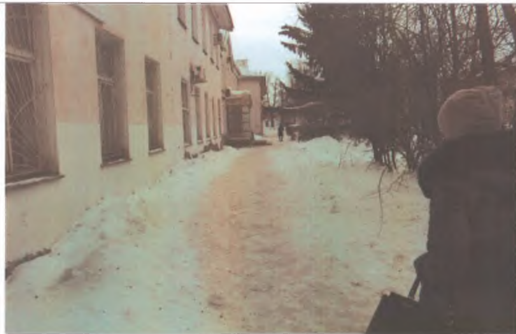
1. Дорога к зданию