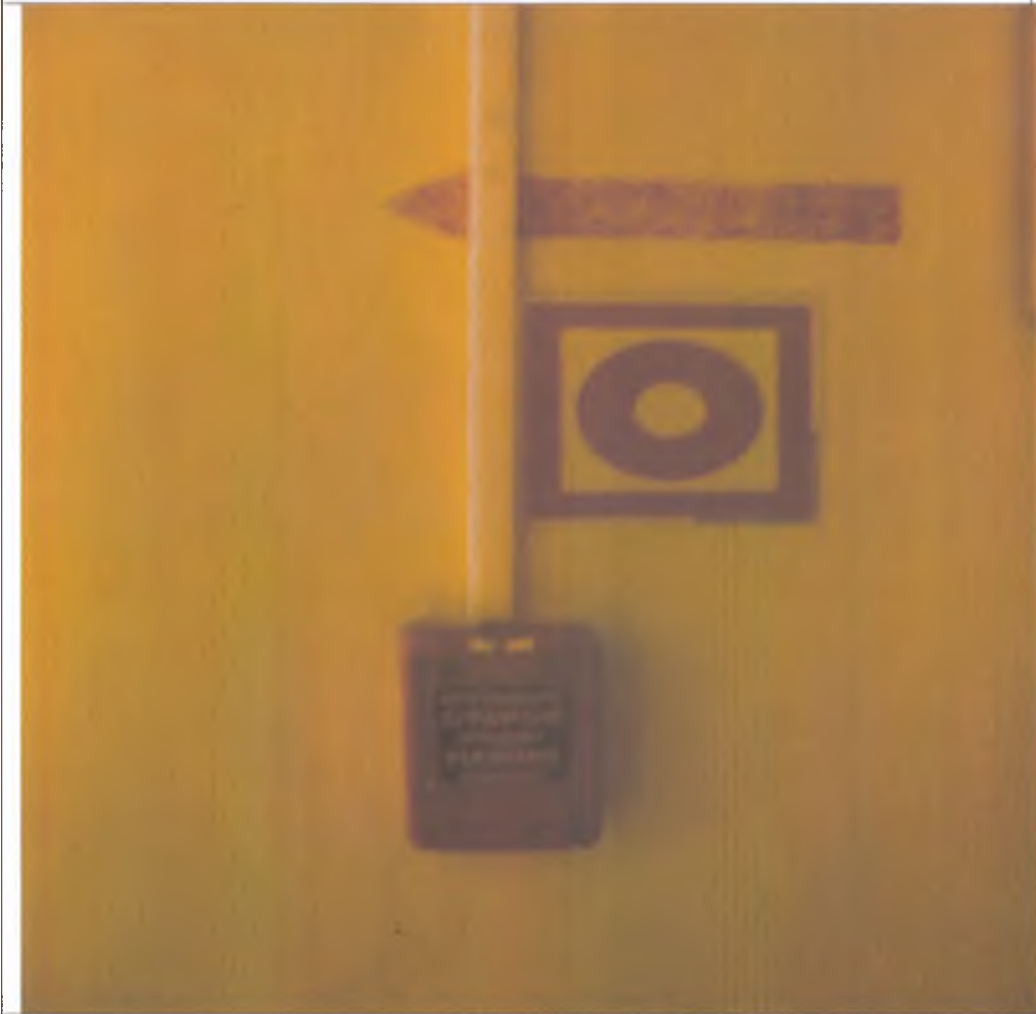
19 Визуальные средства