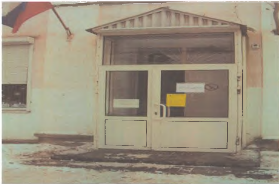
4. Центральный вход