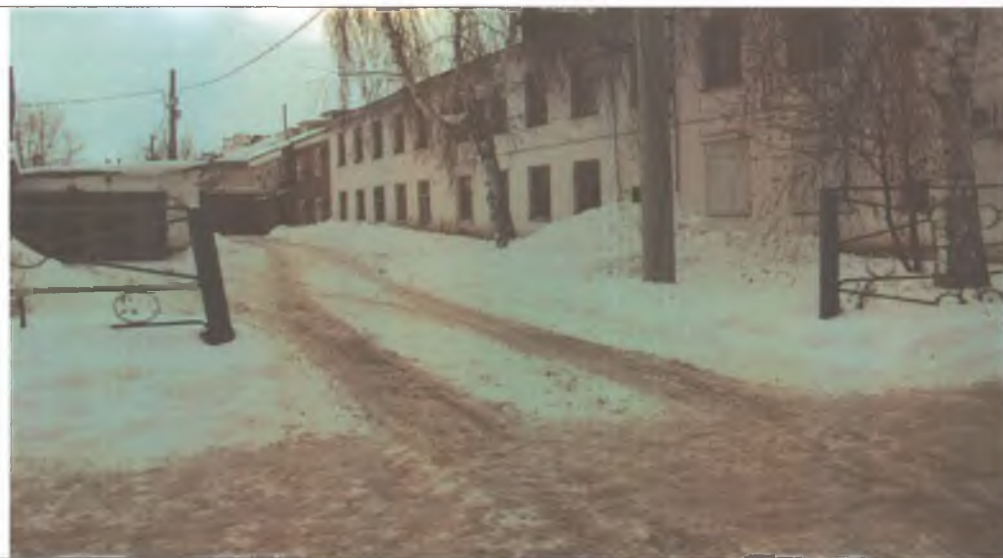
3. Въезд на территорию