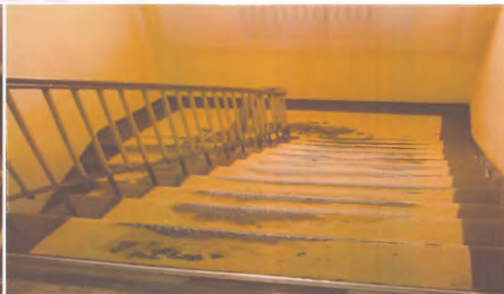
14 пути эвакуации