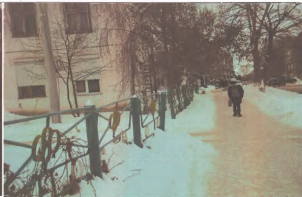
2. Дорога к зданию