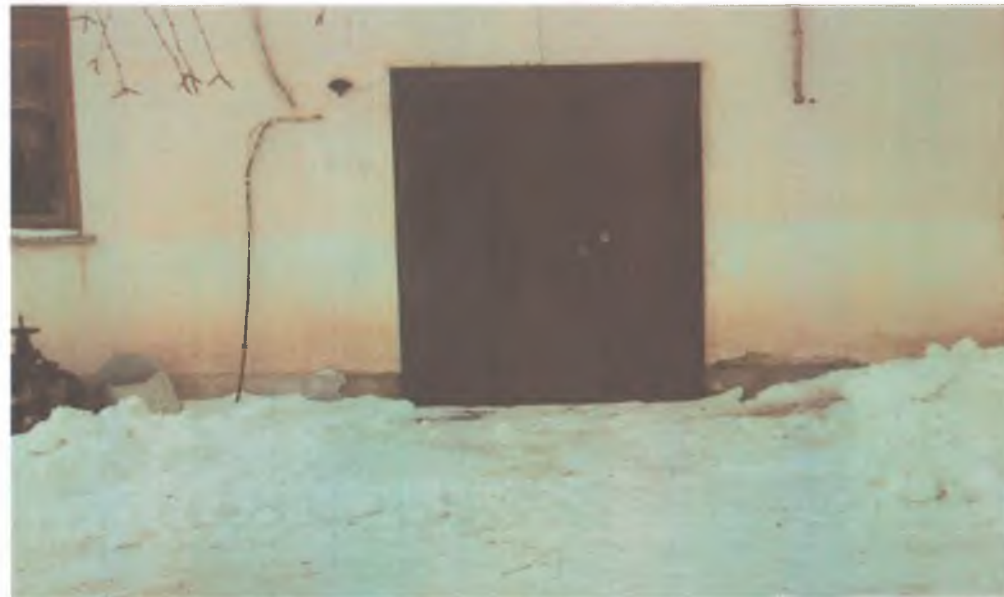
5. Запасной выход