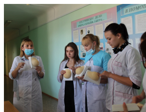
«Всемирный день борьбы с раком молочной железы» -стр. 4-