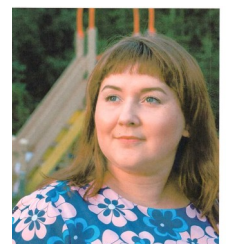
«Интервью с куратором группы» -стр. 6-