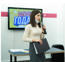
«Студент года—2020» -стр.2-