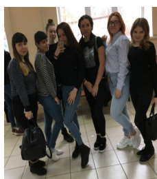
Что такое «Квест-игра» стр. 5