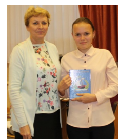
Встреча на ринге стр. 8