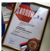
«Молодые профессионалы» (WorldSkills Russia) стр. 2