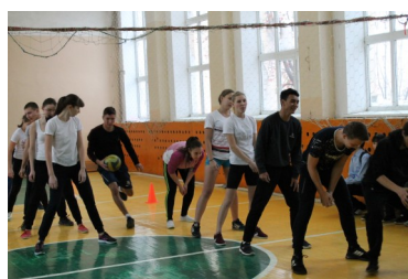
Как живешь, первокурсник? стр. 6