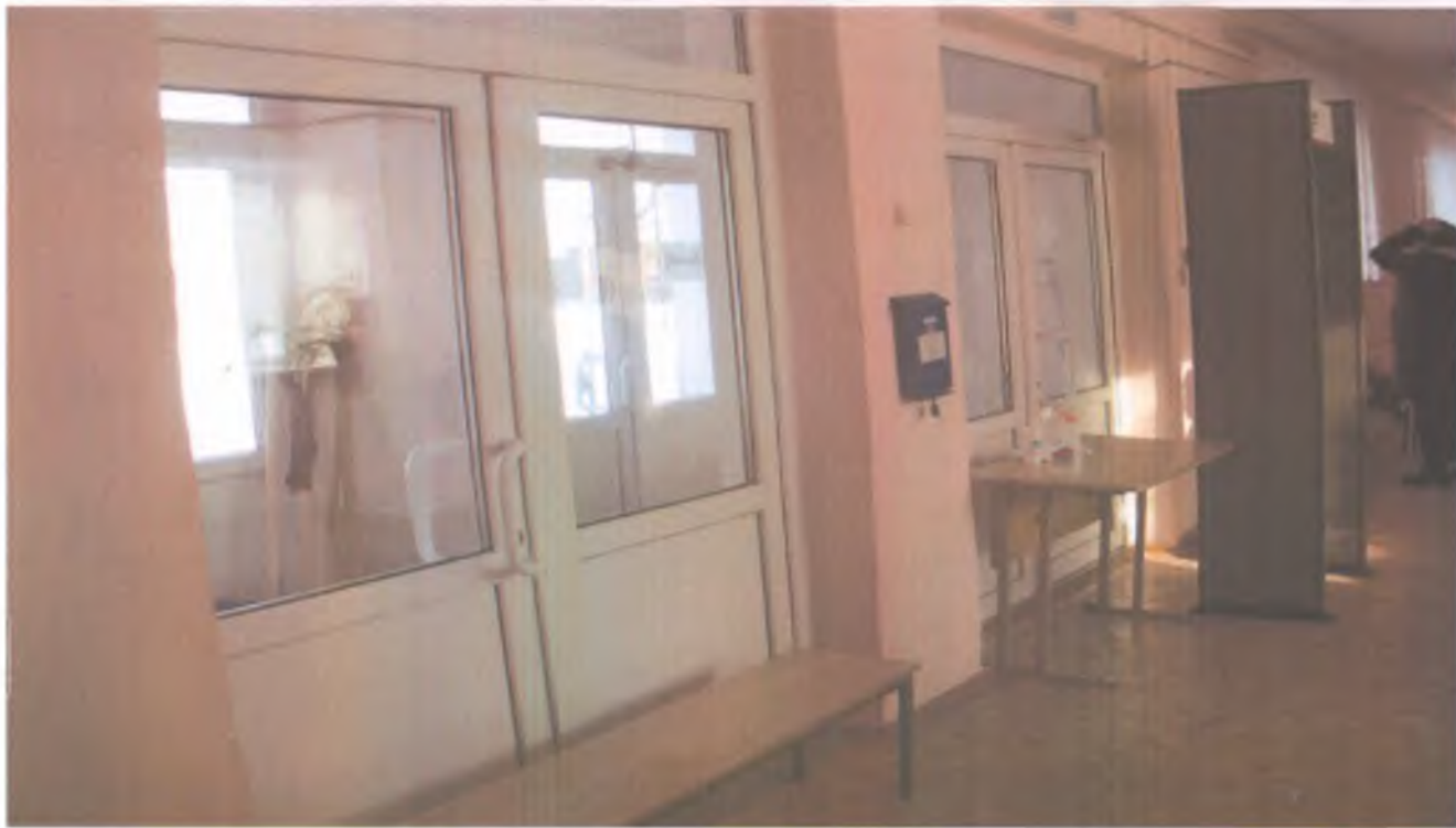
11 входная дверь