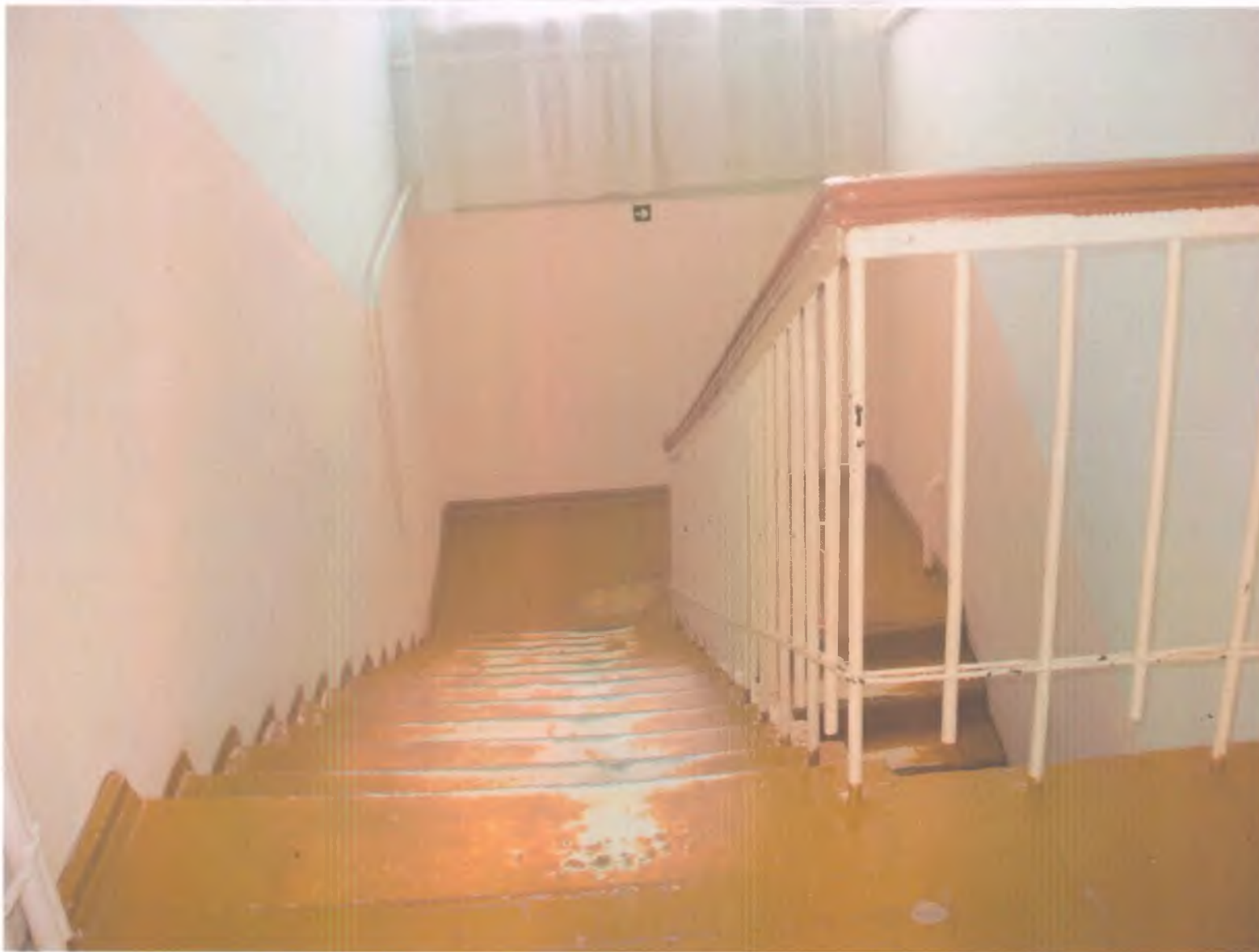
23. Лестница внутри здания