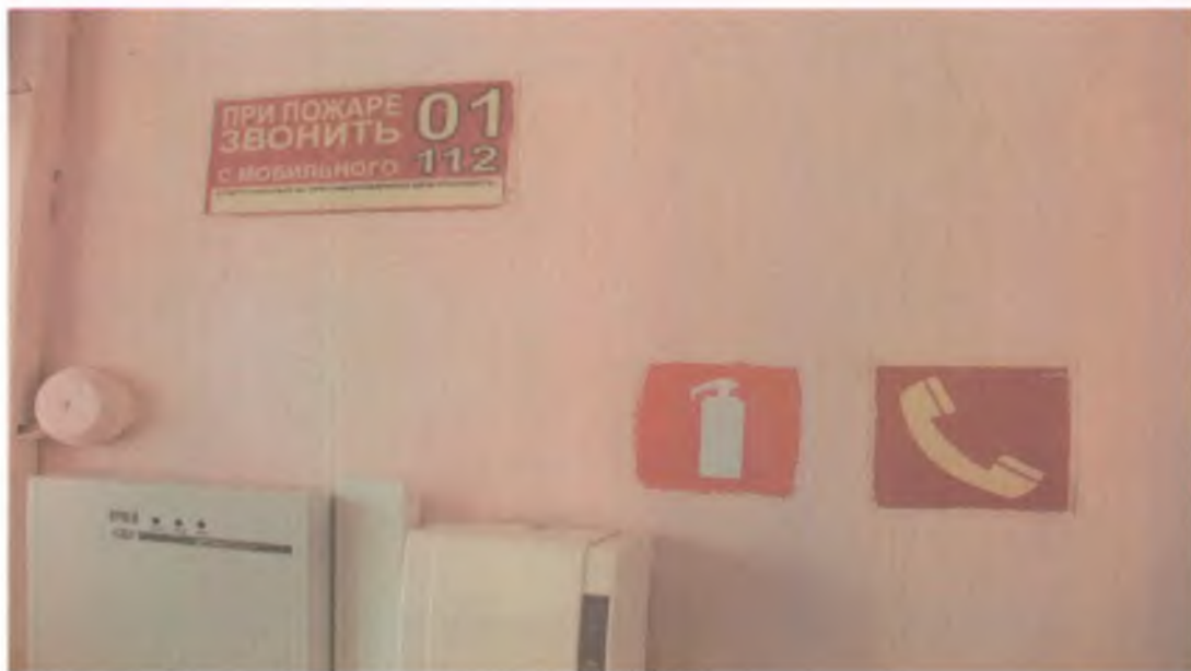
33. Визуальные средства