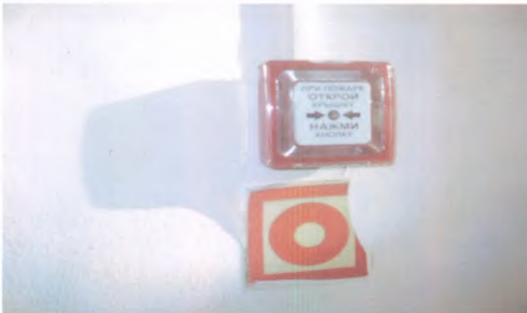
29 Визуальные средства