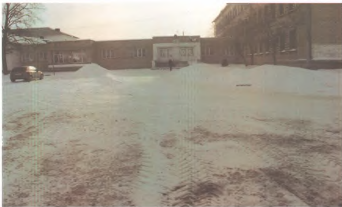
6 пути движения по территории