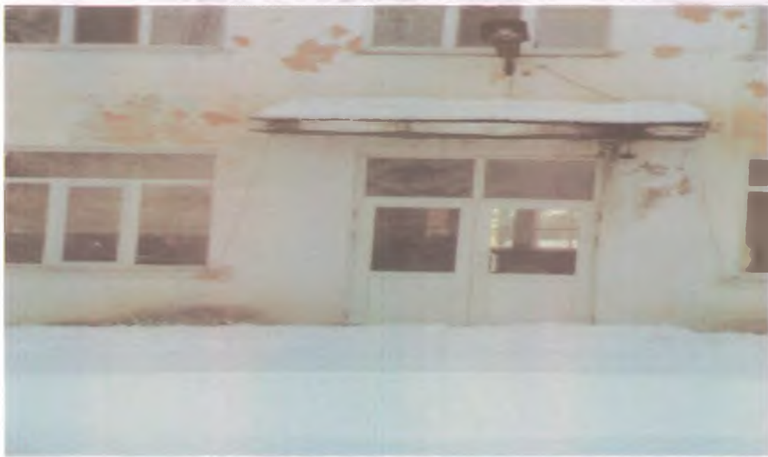
9 запасной выход