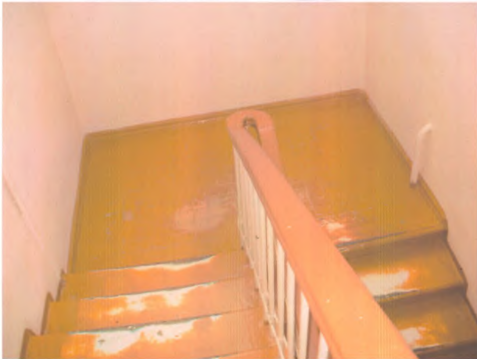
22.лестница внутри здания