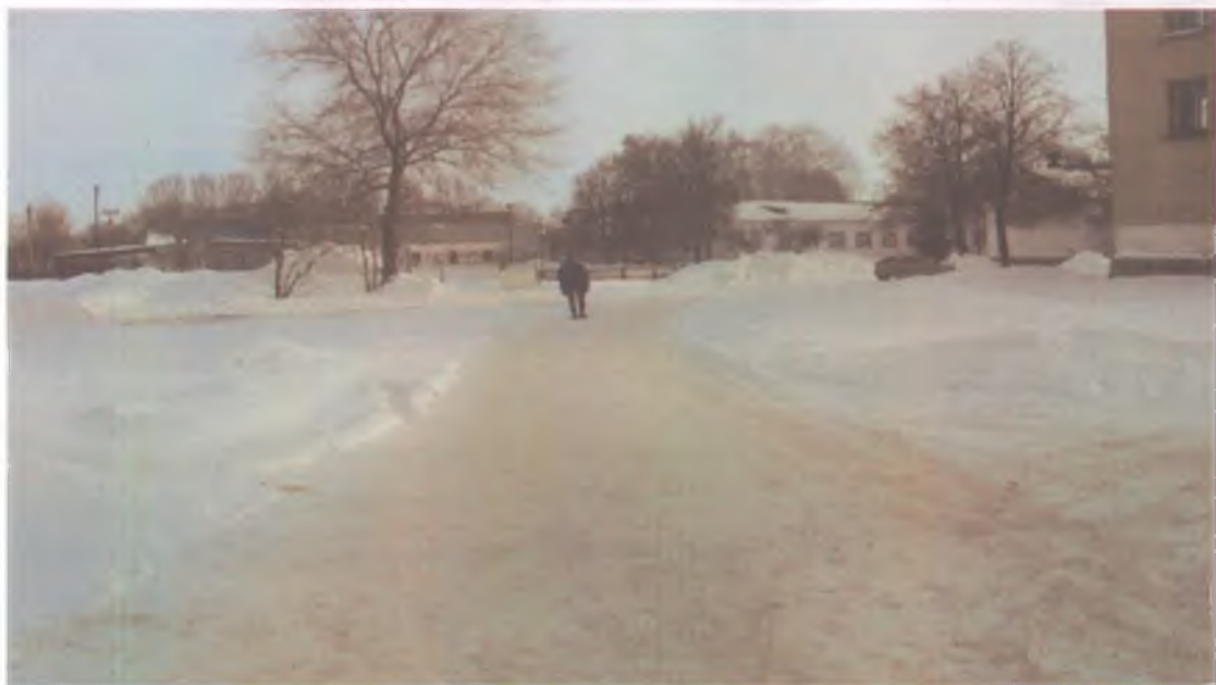
5 пути движения по территории