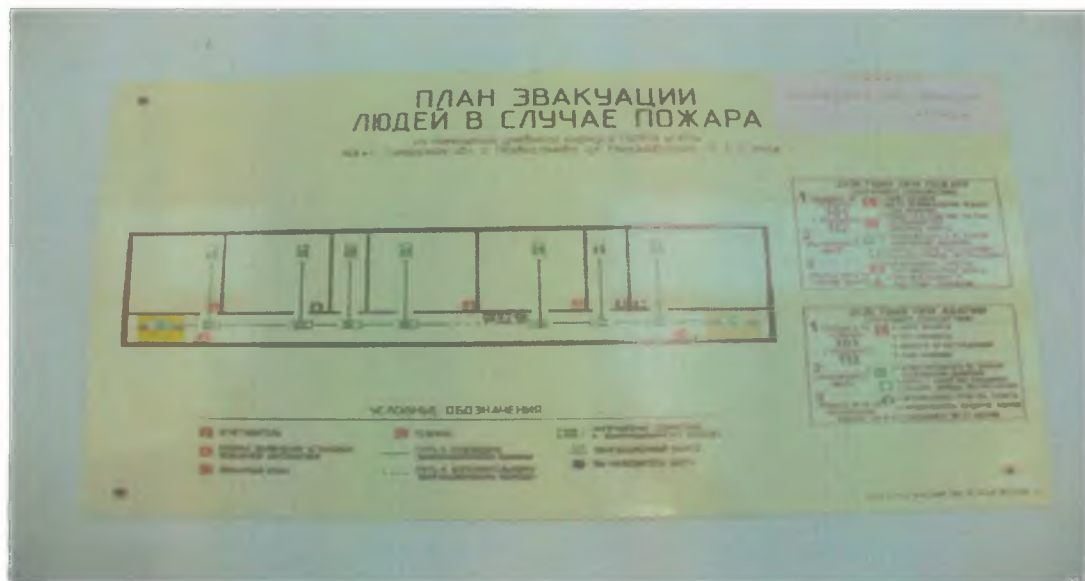
37 Визуальные средства