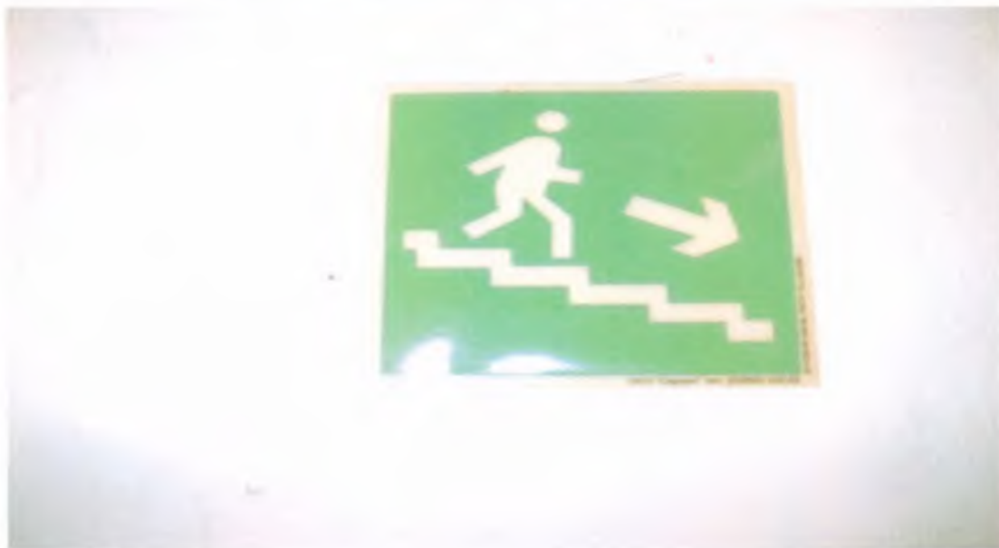
32 Визуальные средства