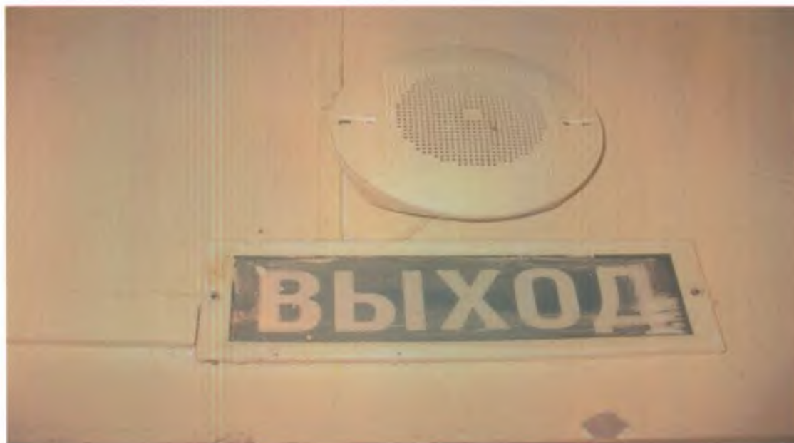
34 Визуальные средства