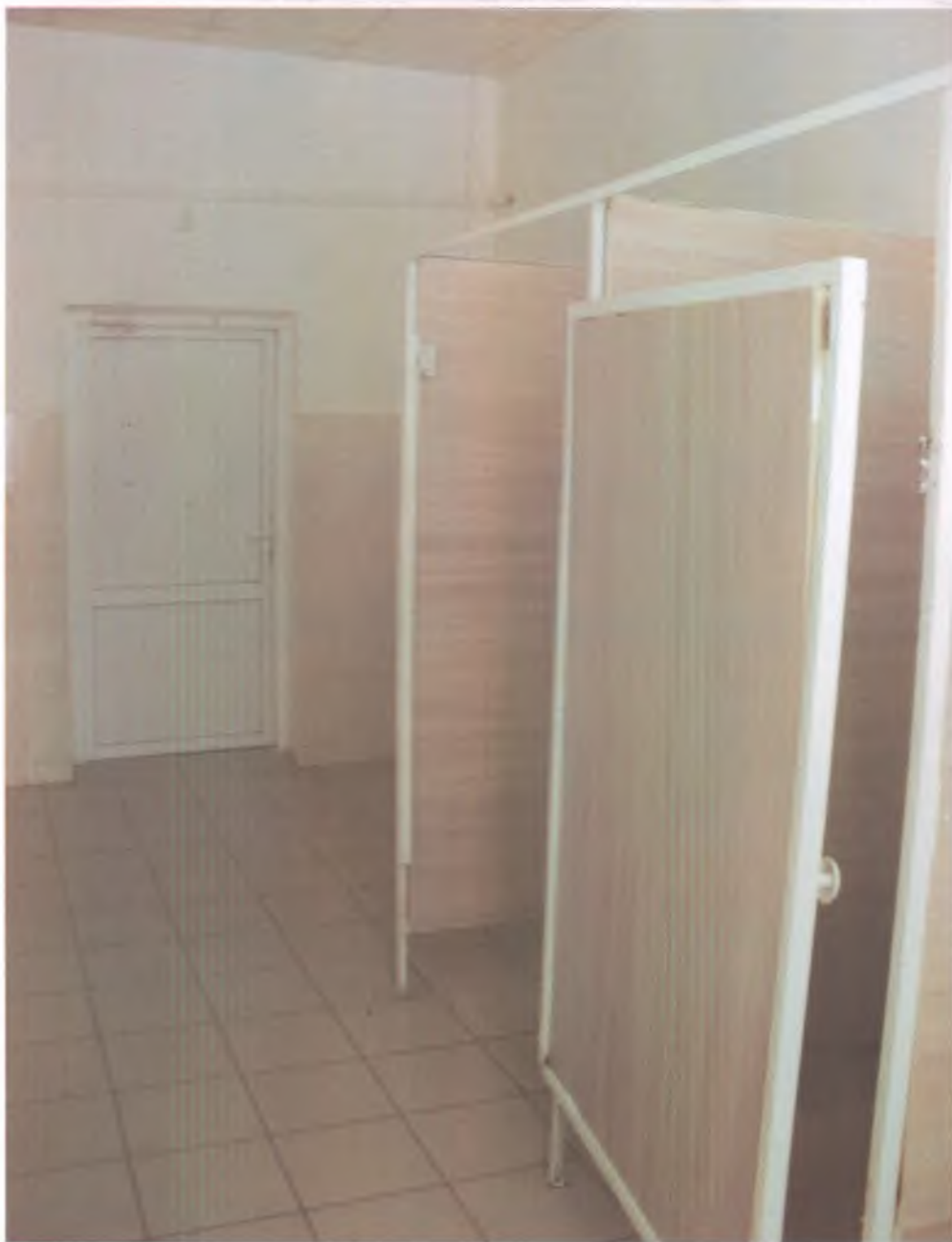
26. Туалетная комната