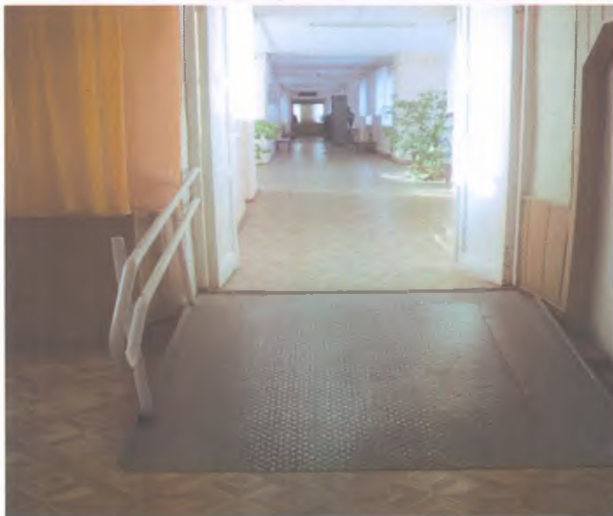
16 пандус внутри здания