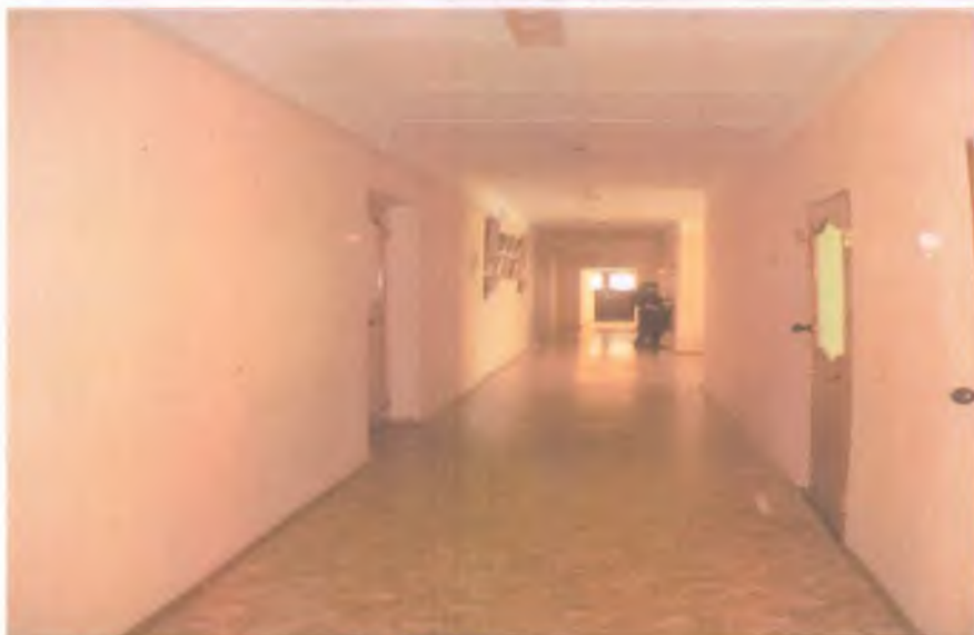
14 коридор 2 этаж