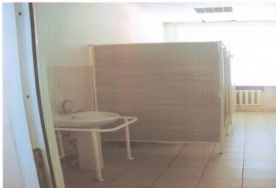
25 туалетная комната