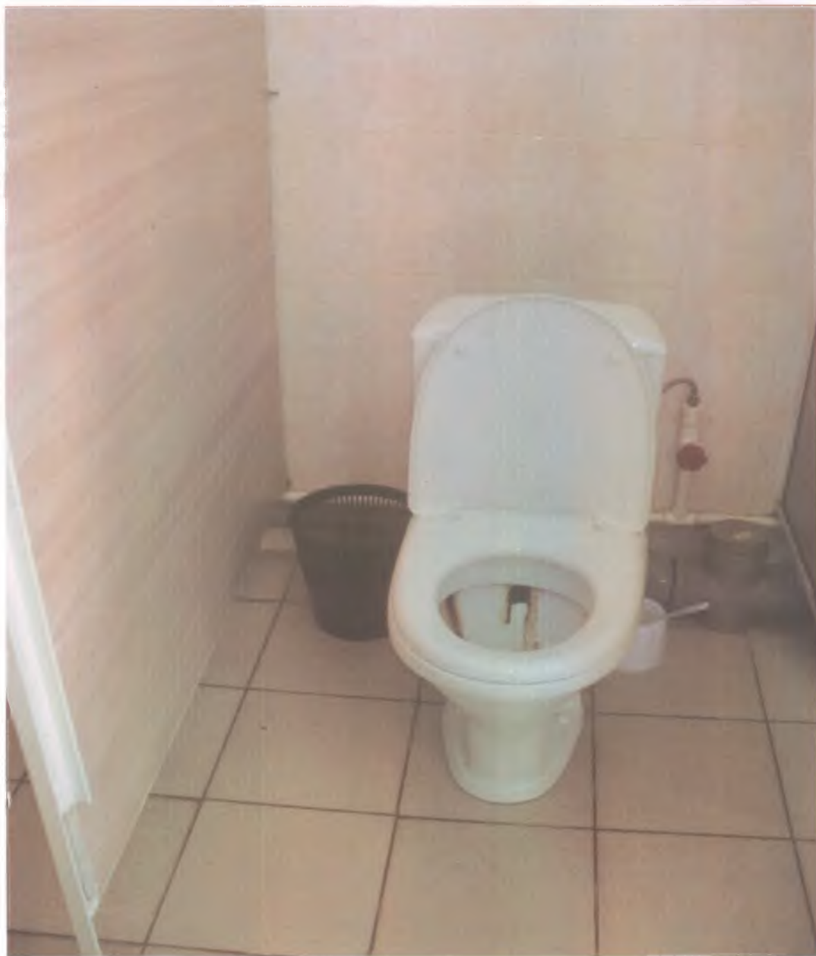
26. Туалетная комната