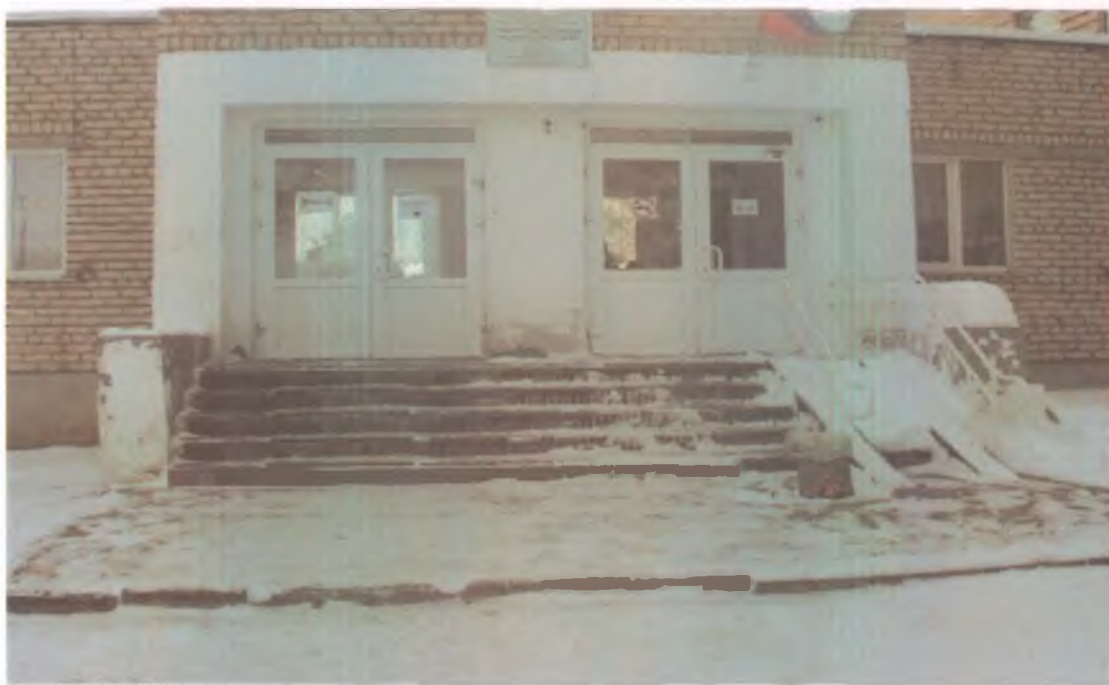
8 центральный вход