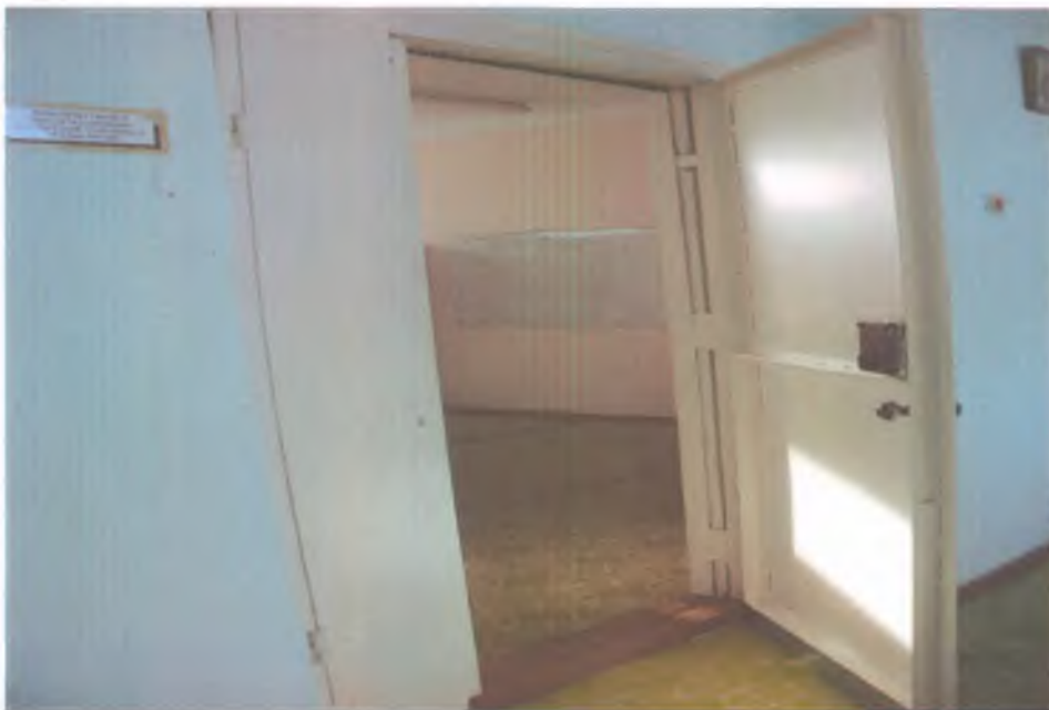
18 дверь внутри здания