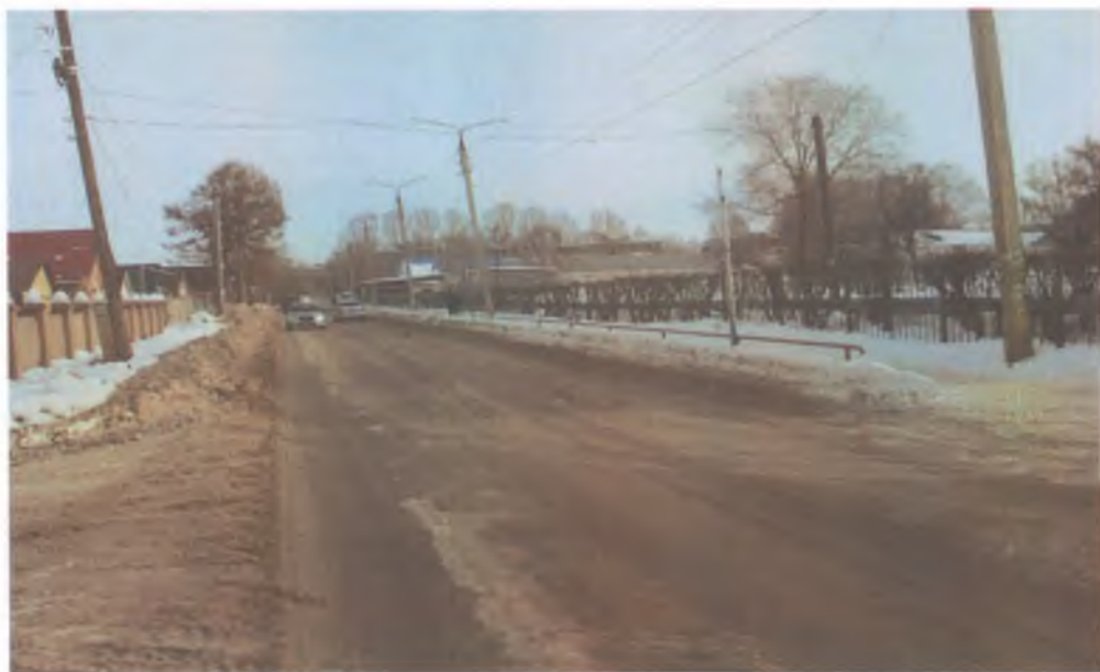
2. Нерегулируемый перекресток