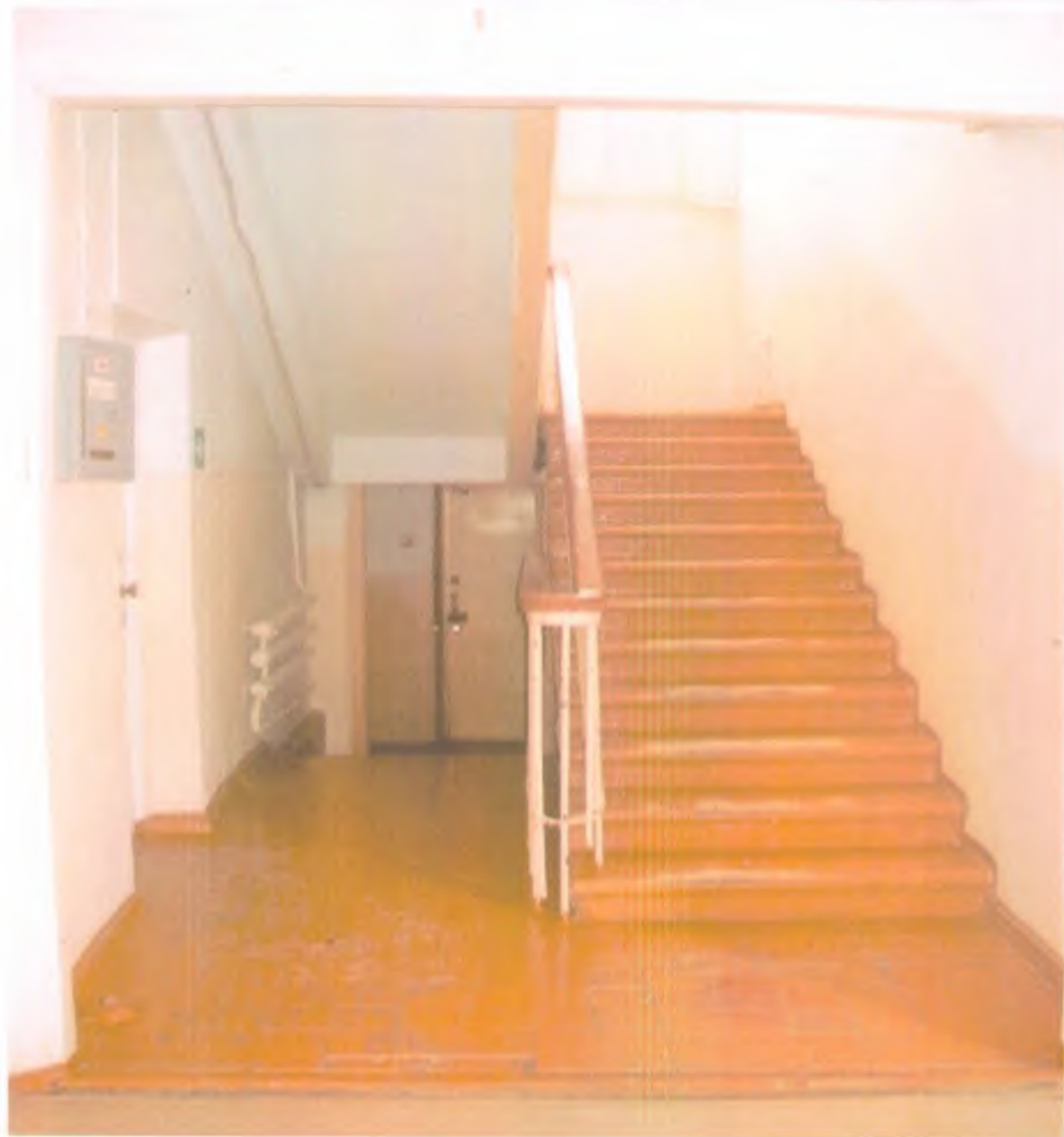
21. Лестница внутри здания