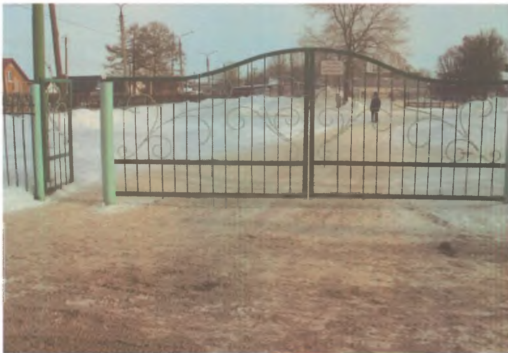
4.вход на территорию