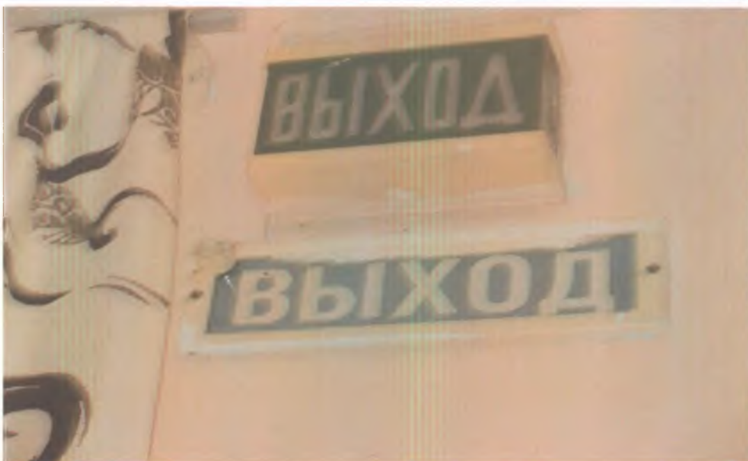
30 Визуальные средства