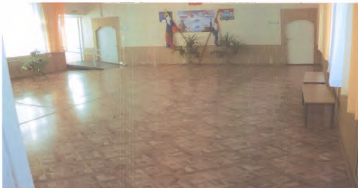
15 зона ожидания