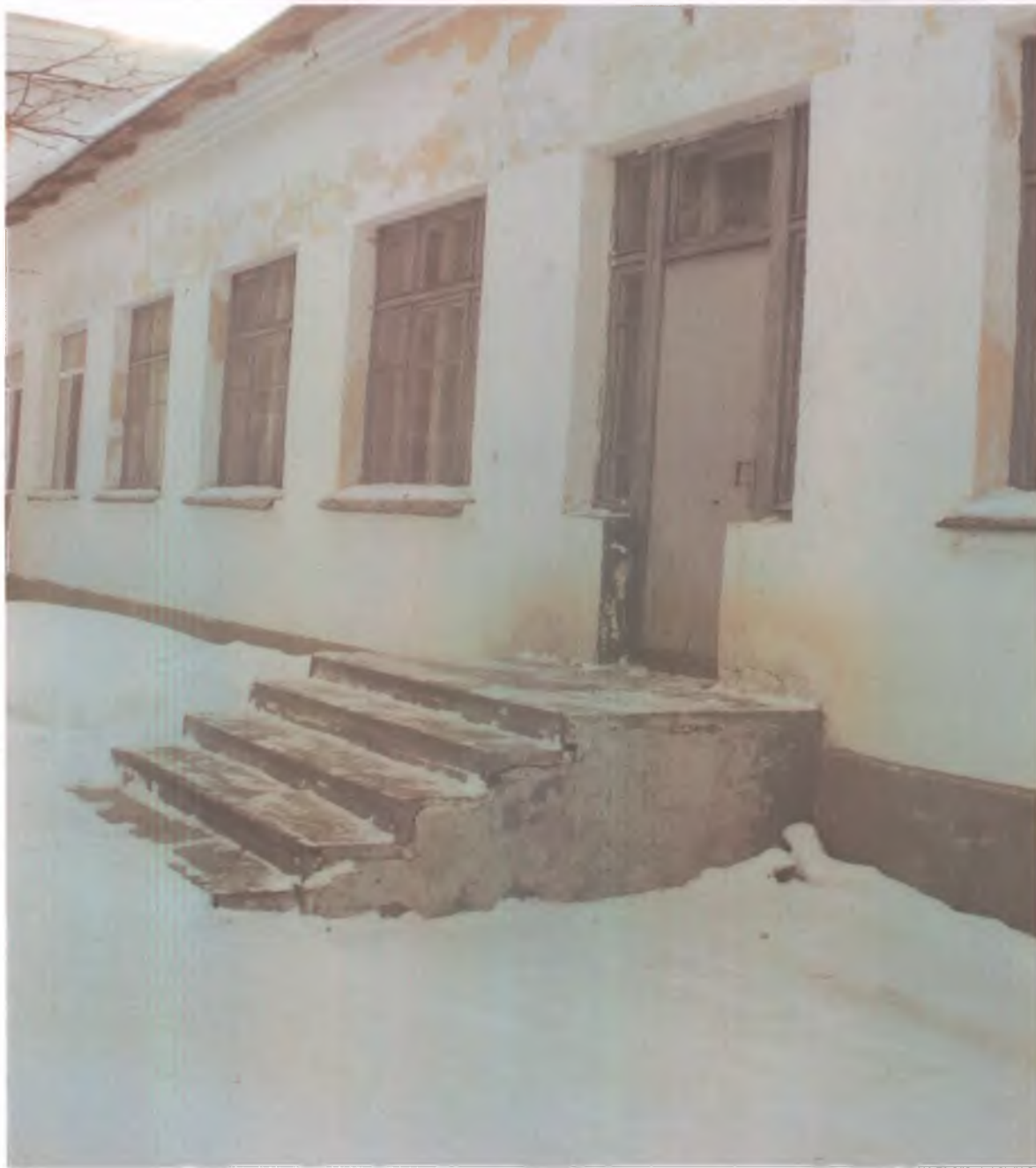
20 пути эвакуации