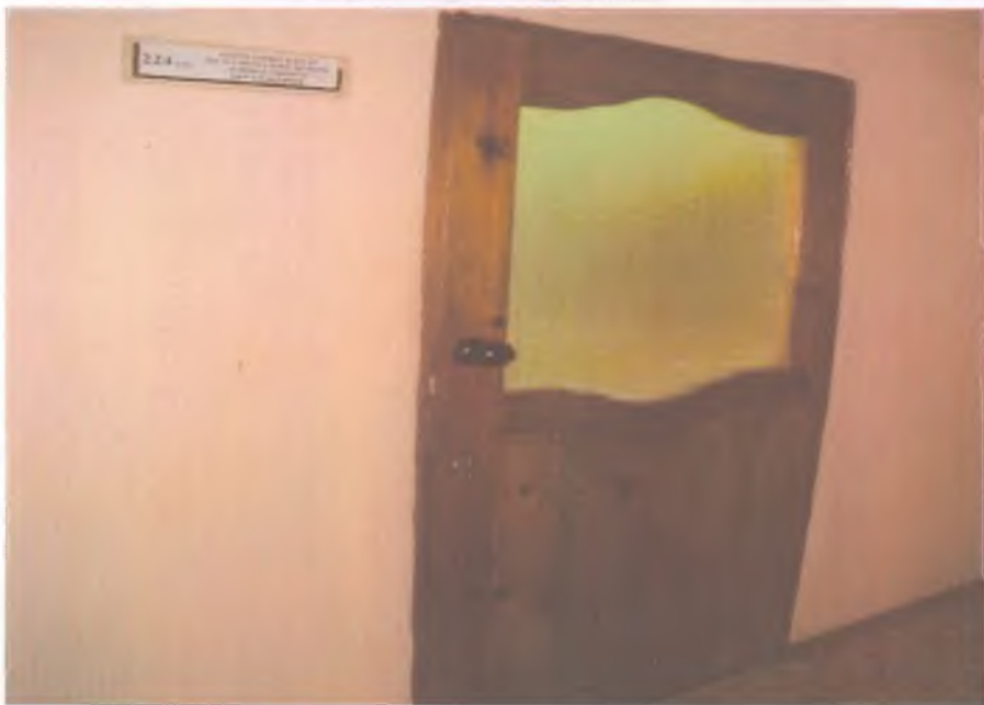
17 дверь внутри здания