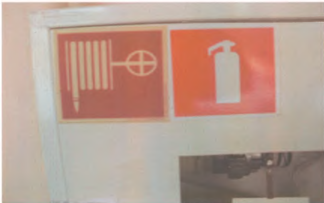
31 Визуальные средства