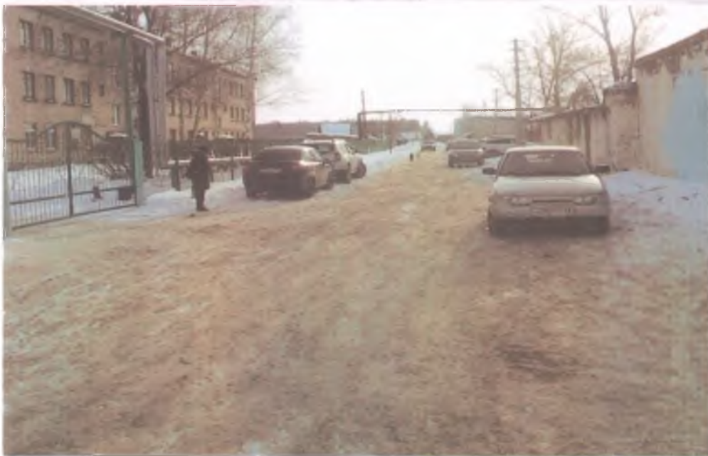
3 проезжая часть