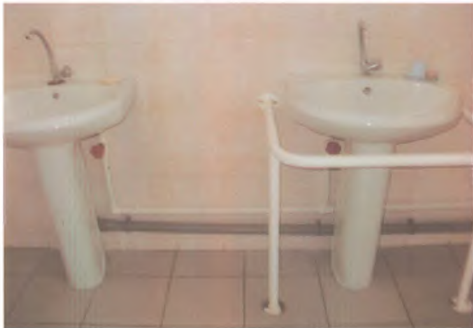
24 туалетная комната