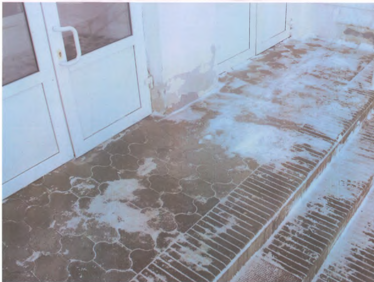
8 площадка перед дверью