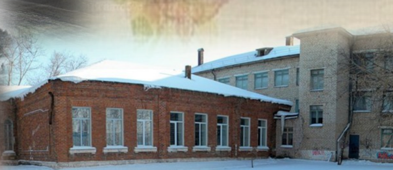
Школа № 9