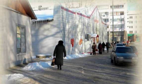
Универсам Магнит, бывший Р.Д.К.