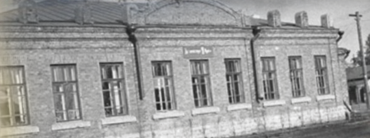
Ж.д. школа №49