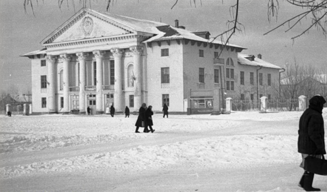
Дворец Культуры. 1962