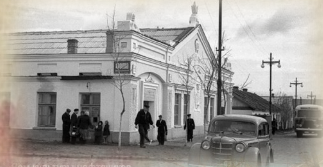
Дом культуры нефтяников