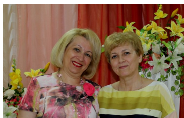
«ИНТЕРВЬЮ С ПЕДАГОГАМИ КОЛЛЕДЖА» -стр.2-