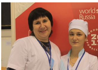
«МОИ ПЕРВЫЕ ШАГИ В ПРОФЕССИИ» -стр.4