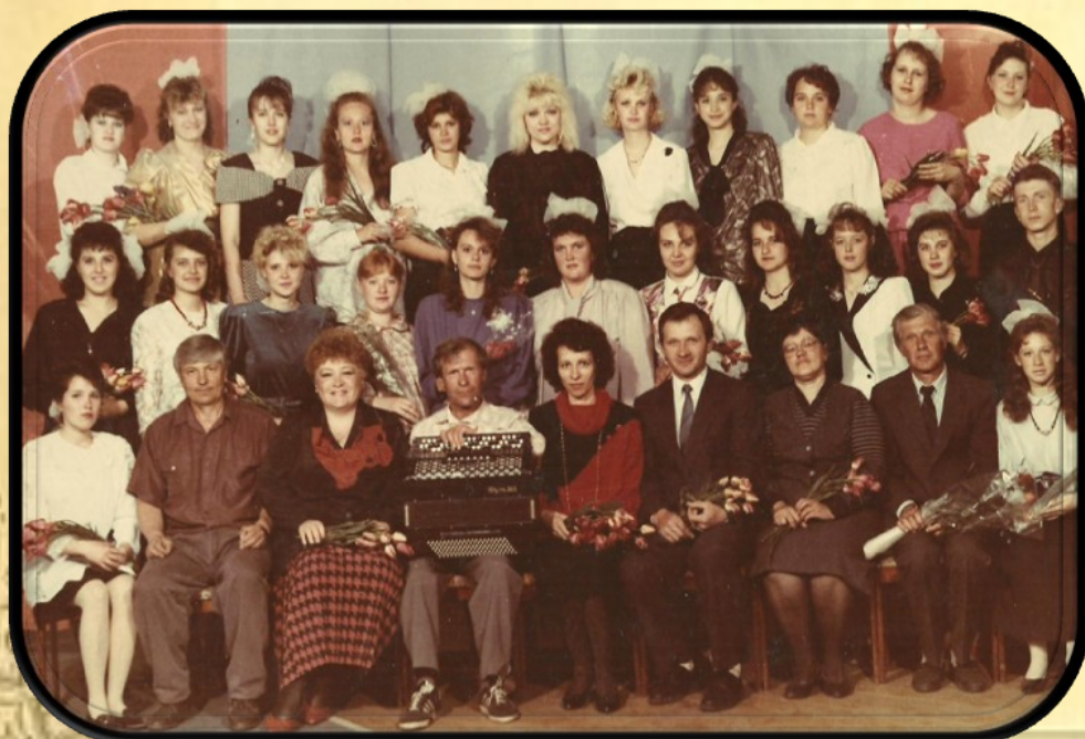
Выпуск Подбельского педагогического училища 1992 г.