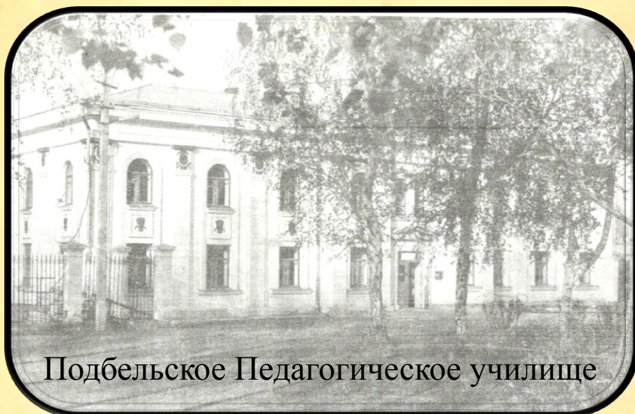
Подбельское Педагогическое училище