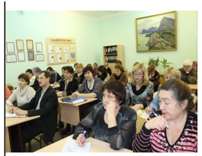
«ПОЗДРАВЛЕНИЯ ОТ ПЕДАГОГИЧЕСКОГО КОЛЛЕКТИВА» -стр.11-