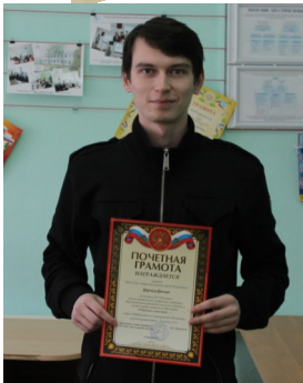
«ЧЕМ ЗАПОМНИЛСЯ УХОДЯЩИЙ УЧЕБНЫЙ ГОД» -стр.3-