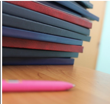
«ВЕСТИ С ГИА» -стр.7-