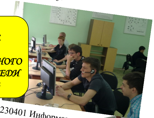
230401 Информационные системы