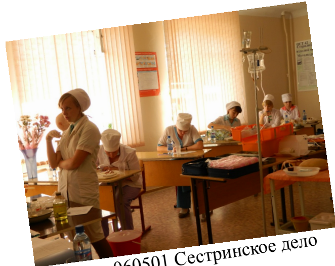
060501 Сестринское дело

ФЕВРАЛЬ - ПРОВЕДЕНИЕ КОНКУРСОВ ПРОФЕССИОНАЛЬНОГО МАСТЕРСТВА СРЕДИ СТУДЕНТОВ