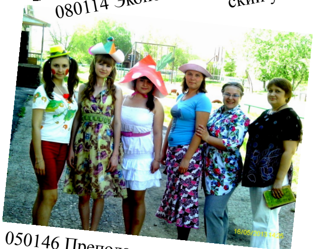
050146 Преподавание в начальных классах