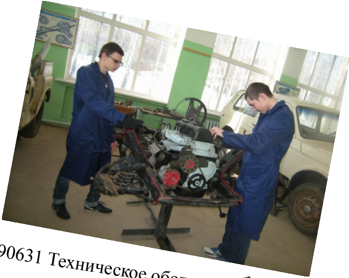
190631 Техническое обслуживание и