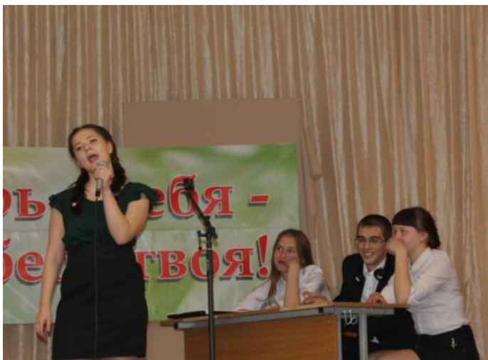
Презентация специальности Преподавание в начальных классах

Завершилось мероприятие презентацией-визиткой профессий и специальностей, которые можно освоить в колледже. Студенты в шуточной форме представили специальности и рабочие профессии.