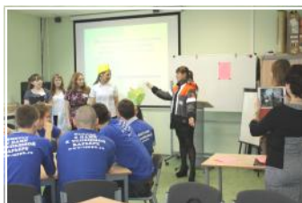
«ПОБЕДА НА ПЕДАГОГИЧЕСКОЙ ОЛИМПИАДЕ» -стр.2-