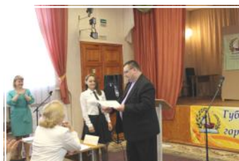
«В ПРОФЕССИЮ ЧЕРЕЗ НАУКУ И ТВОРЧЕСТВО» -стр.4