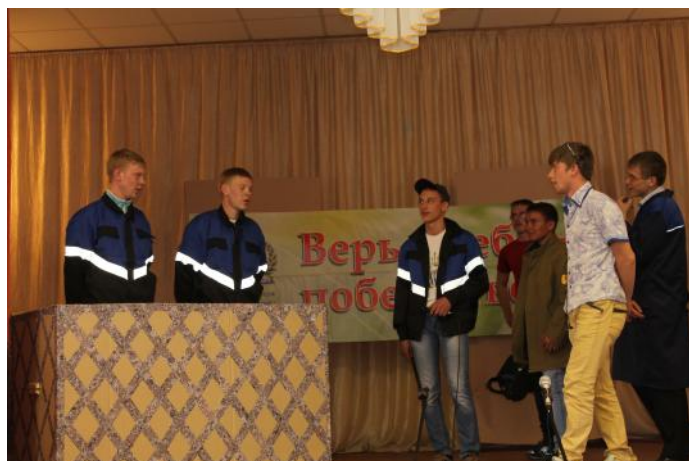
Презентация рабочих профессий

Квалификация - Учитель начальных классов.