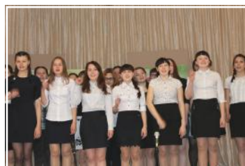
«СТАНЬ УСПЕШНЫМ ВМЕСТЕ С НАМИ» -стр.6-