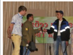
«НАБОР НА 2016-17 УЧЕБНЫЙ ГОД» -стр.7-