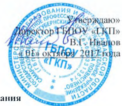
График проведения промежуточной аттестации на зимней сессии 2017– 2018 учебного года (очно-заочная) форма получения образования