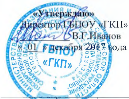
График проведения промежуточной аттестации на зимней сессии 2017-2018 учебного года